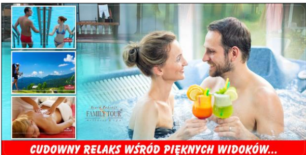
CUDOWNY RELAKS WŚRÓD PIĘKNYCH WIDOKÓW...

2x dziennie: śniadania – bogate szwedzkie stoły, obiadowe kolacje – wybór z menu + bufet sałatkowy. Kucharz serwuje dania kuchni regionalnej oraz międzynarodowej. Płatne dodatkowo tylko napoje do obiadowych kolacji. Na 8 dni (7 nocy) dodatkowo podawane obiady.